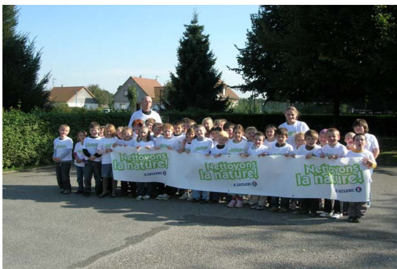
26 septembre 2008 Opération « Nettoyons la nature » dans les rues du village