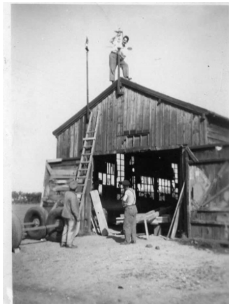
Réparation de la girouette