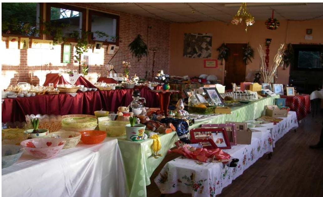
« Marché de Noël » Premier dimanche de Décembre.

Tous les jeudis (et parfois les mardis) nous nous retrouvons afin de préparer notre traditionnel Marché de Noël. Cela demande énormément de travail, d'organisation et d'énergie.