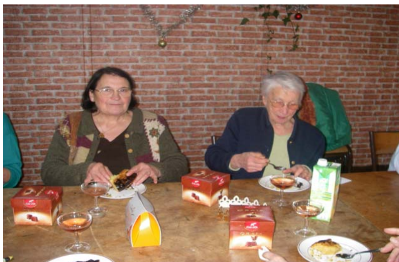
La secrétaire et la trésorière en pleine dégustation.

Février : Enfin les soldes et toujours en quête de l'affaire du siècle.