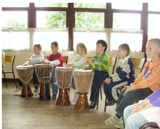
Initiation au djembé