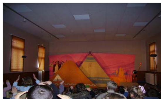
Spectacle à Normanville : « Petite Indienne »