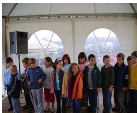
Mai 2008 : Les élèves au Festival des Arts du cirque à Rouen